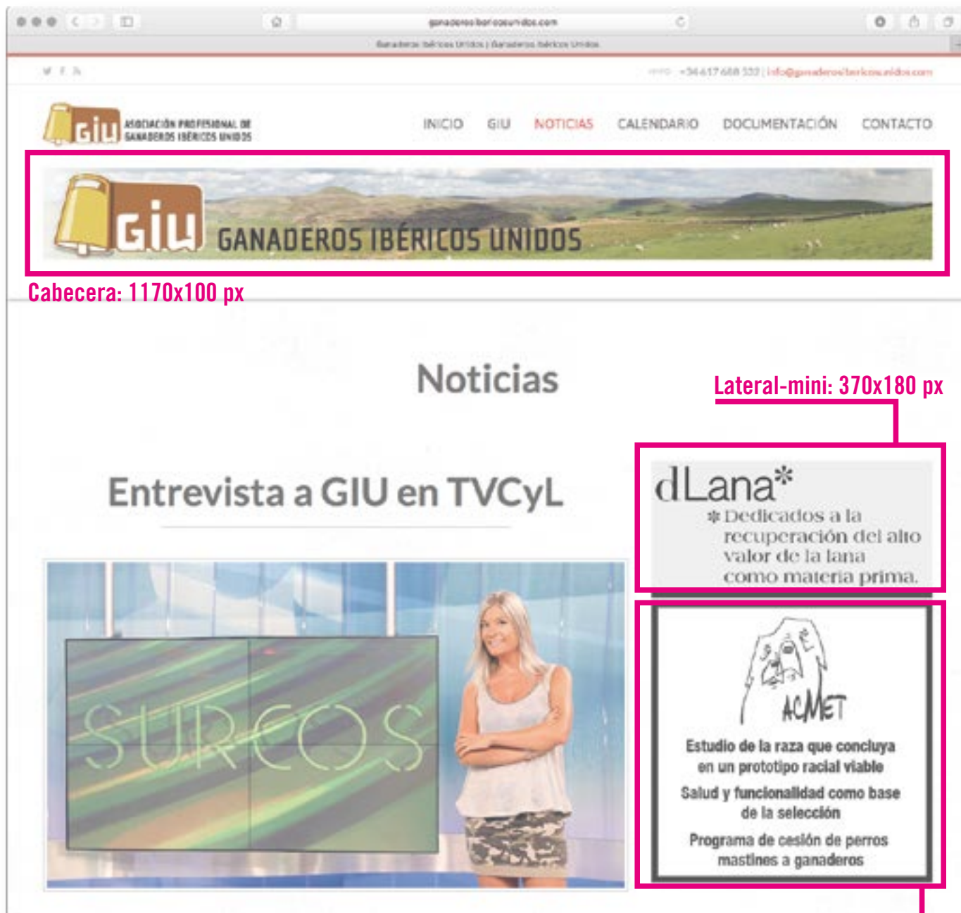
Cabecera: 1170x100 px